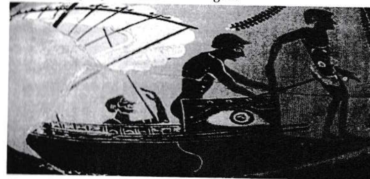
Rasm 1. Qadimgi Misr jabgari suzuvchilari Nil daryosida.

Inson yer yuzida paydo bo'lganidan buyon uning hayoti har doim suv bilan bog'liq. Bashariyat tamadduni yirik daryolar: Nil, Tigr, Yevfrat, Xuanxe, Yan-szi, Hind va Gang vodiylarida rivoj topgan. Odamlarni o'ziga jalb qilgan suv havzalari ular uchun faqat hayot manbangina emas, balki ozuqa topish mumkin bo'lgan joy, kutilmagan hujumlardan asraydigan to'siq, o'zaro aloqa va almashuvning qulay vositasi hisoblangan.