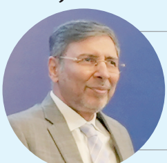
Жовхар САЛИМ, IRS президенти

– Бу китоб – Янги Ўзбекистоннинг шарафли тараққиёт йўлига бағишланган. Ўзбекистон қандай мураккаб ривожланиш йўлини босиб ўтгани бошқа мамлакатлар, шу жумладан, Покистон учун ҳам намуна бўла олади. Президент Шавкат Мирзиёев бошчилигида Ўзбекистон сиёсий, иқтисодий ва маданий-маърифий жиҳатдан ҳар томонлама ривожланмоқда.