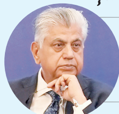
Муртазо САЛАНГИ, Покистон Президентининг Матбуот котиби

– Ўзбекистон – ажойиб мамлакат. Мамлакатларимизни, халқларимизни ўзаро боғлаб турган ришталар жуда кўп. Ўзбекистон – Покистон ҳамкорлигини янада ривожлантириш учун имкониятларимиз чексиз. Яқинда Ўзбекистонга таширф буюрдим ва Президент Шавкат Мирзиёев раҳнамолигида республикада амалга оширилаётган ислохотларнинг натижаларига бевосита гувоҳ бўлдим. Мен Ўзбекистоннинг ўзгариб бораётган қиёфасини таълимда ҳам, соғлиқни сақлашда ҳам, инфратузилма ва бошқарув тизимида ҳам кўрдим.