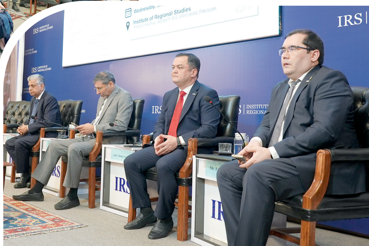
Мирзиёев МИРЗАМАСЛОВ олган суратлар