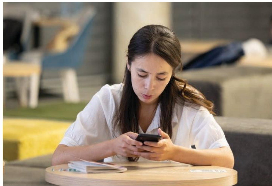
Davomi. Boshlanishi 1-sahifada.

Operatorlar o'z bayonotlarida narxlarning ko'tarilishini "xizmat sifatini yaxshilash" va "tarmoqni kengaytirish" zarurati bilan bog'lagan. Buni qaysidir ma'noda asosli sabab sifatida qabul qilish mumkin, lekin iqtisodchilar, keng jamoatchilik va sun'iy intellekt tahlillari "operatorlar o'zaro til birlashtirib olgan" haqida yozishmoqda. Agar jamoatchilik fikriga quloq tutsak, yuqoridagi bayonot bahonaga aylana-di. Shuningdek, jahonda "tarmoqlarni kengaytirish" uchun muqobil yechimlar bor. Avstraliya, Hindiston kabi davlatlarda operatorlar o'zaro kelishuv asosida yagona infratuzilmadan foydalanadi. Ya'ni hududlarda umumiy bazaviy stansiyalar qurilgan. Shu tariqa Hindistonda eng past aloqa operatorlari narxlari shakllangan (1 GB = 0.10-0.20 dollar). Qolaversa, Afrika davlatlarida ham bir qancha kompaniyalar shu tizimni yo'lga qo'yish bo'yicha ishlayapti.