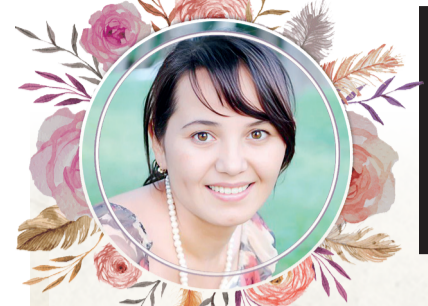
Бир жуфт шеър