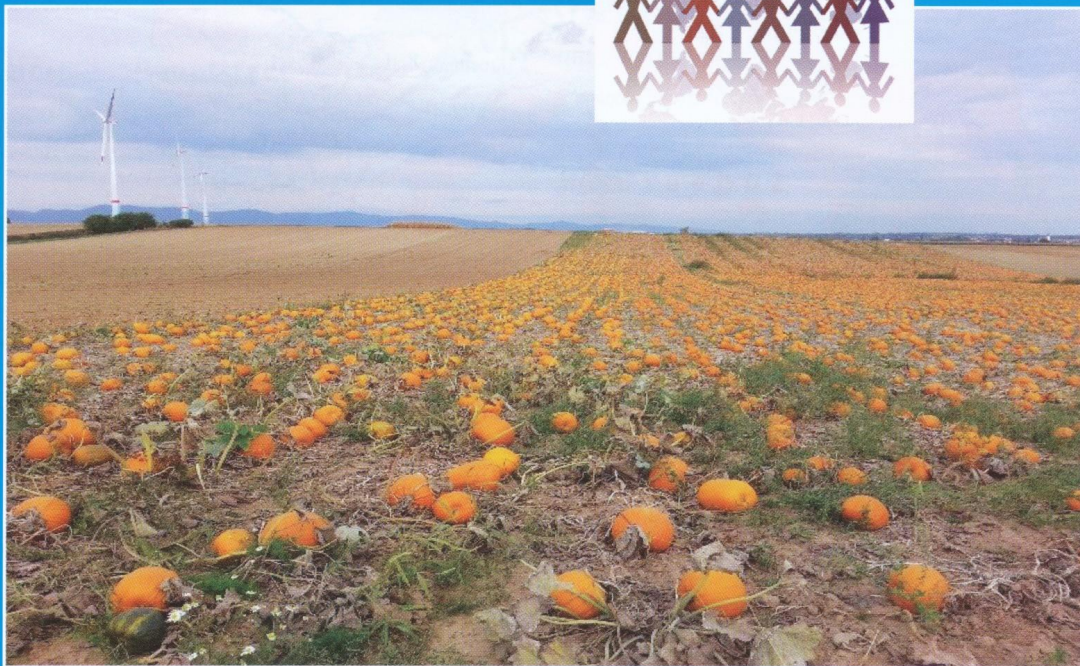
Landschaft in Rheinland-Pfalz (Kürbisfeld)