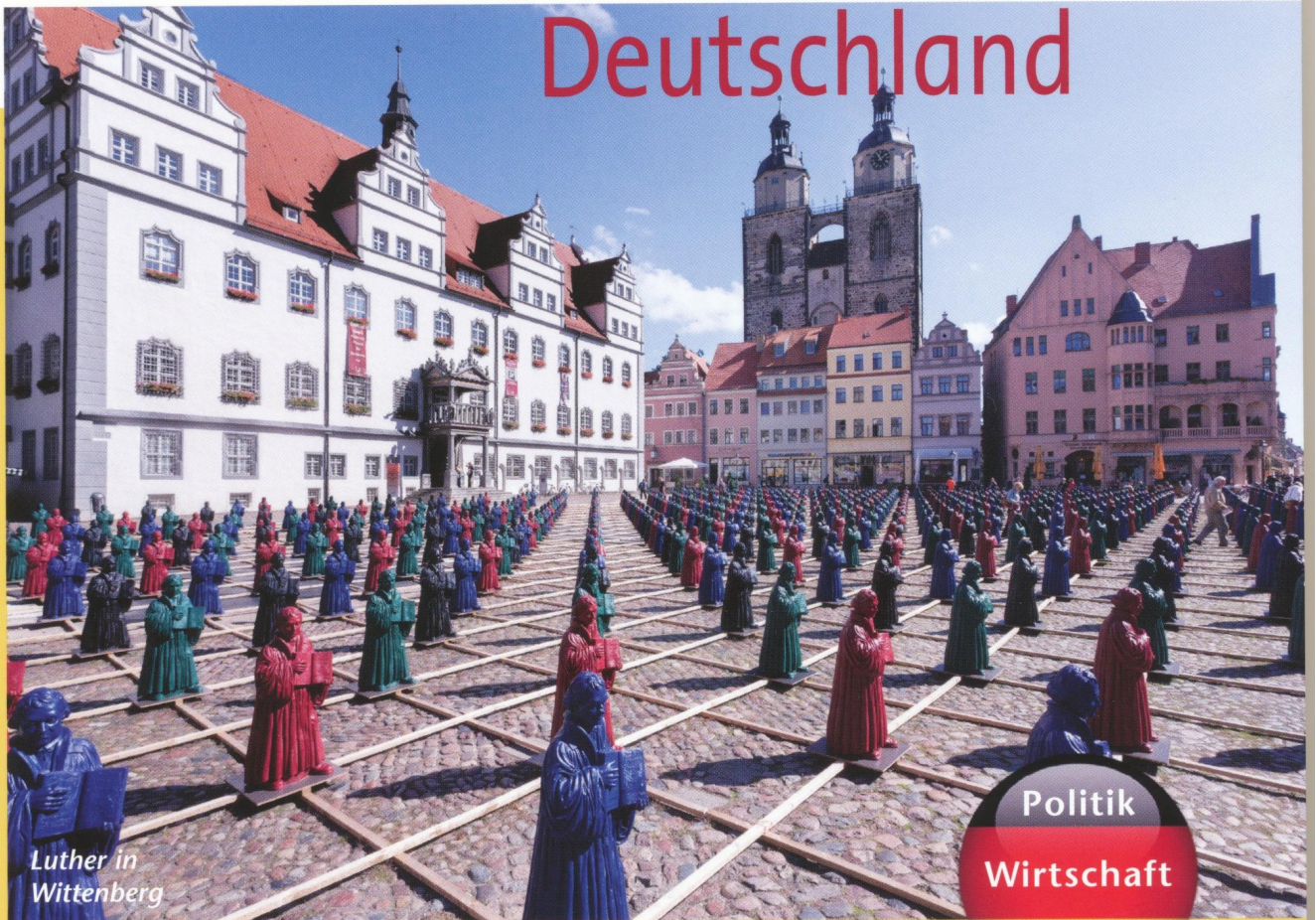
Luther in Wittenberg