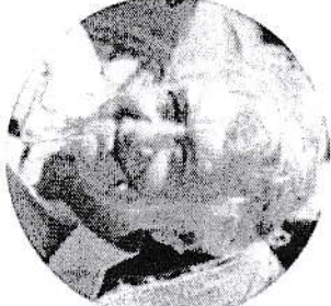
3-rasm. Ladislav Kovach

Kovachning Kognitiv Biologiyasi "Kognitiv biologiyaga kirish" (Kovacs, 1986) asarida Kovach "Kognitiv biologiya o'nta tamoyillari" to'yinlati ko'rsatadi. 1987 yili esa, bir - biri bilan chambarchas bog'liq o'ttiz sahifali maqola chop etildi: Kimyo, genetika va fizika o'rtasidagi bioenergetika haqida umumiy ma'lumot" nomli maqolani chop etirdi. (Kovach, 1987).