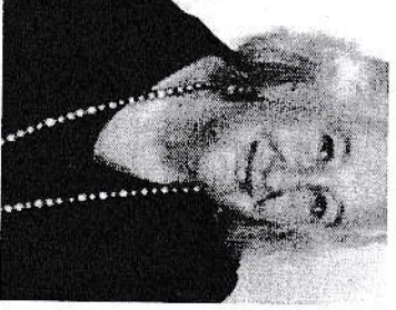
2-rasm. Margaret Boden