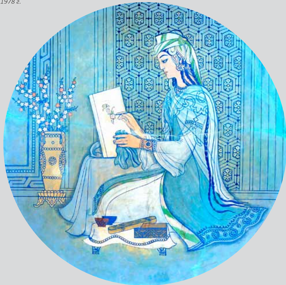
Ч.Ахмаров. Муза живописи. Фрагмент росписи в Институте искусствознания. Ташкент. 1978 г.