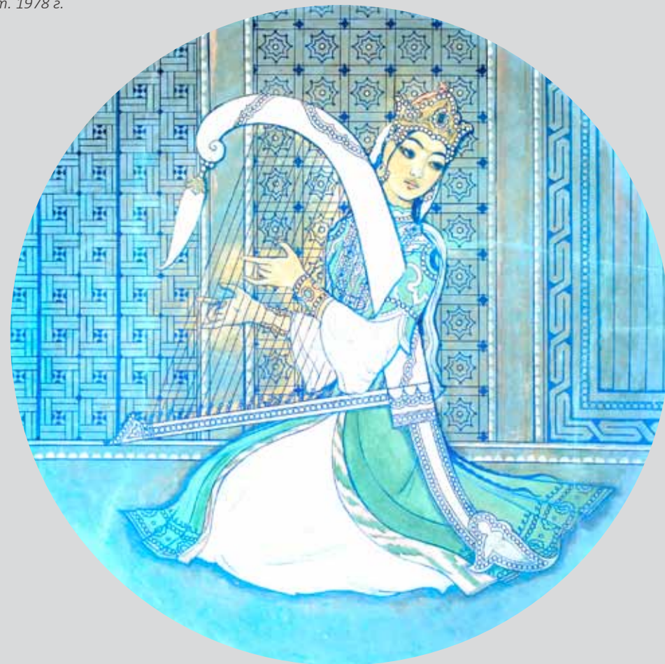
Ч.Ахмаров. Аллегория музыки. Фрагмент росписи в Институте искусствознания. Ташкент. 1978 г.