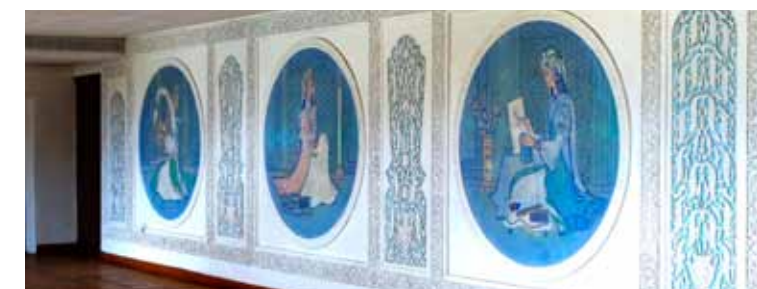
Ч.Ахмаров. Общий вид настенной росписи в Институте искусствознания. Ташкент 1978 г.