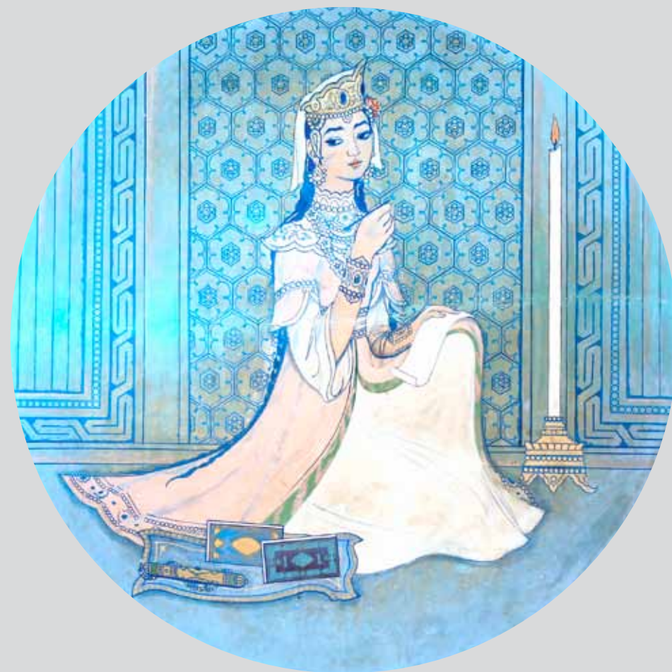
Ч.Ахмаров. Муза поэзии. Фрагмент росписи в Институте искусствознания. Ташкент. 1978 г.