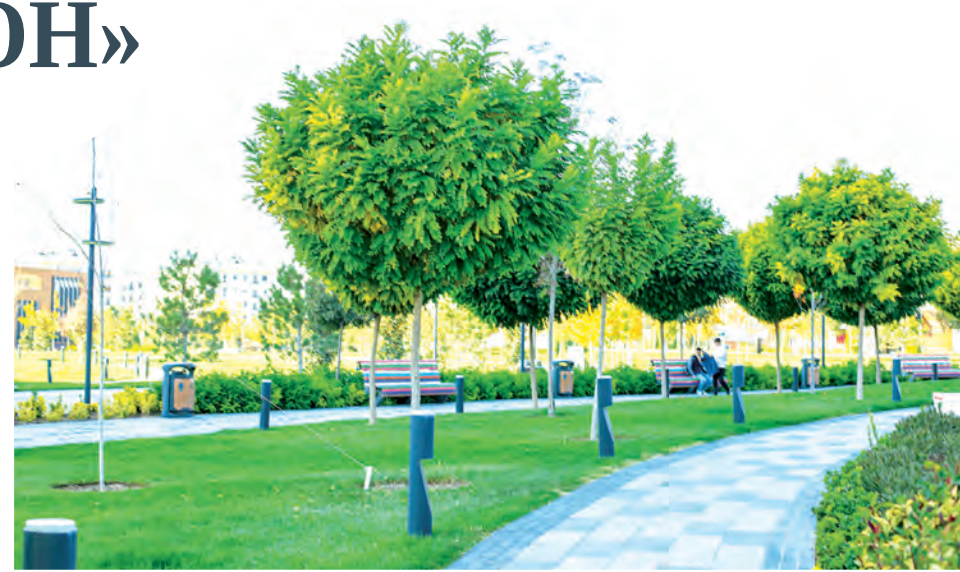
← (Окончание. Начало на 1-й стр.)

Важно, что общенациональный проект строится на принципах устойчивости и продуманности. Отдельное внимание уделяется выбору растений, адаптированных к климату, а также современным методам ухода за ними. Это позволяет формировать полноценные зеленые экосистемы, которые будут радовать не одно поколение.